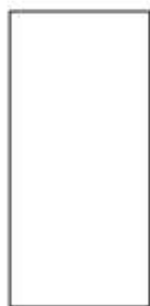
satin rettificato polished rettificato

• 60 x 120 24" x 48" 67 84 80 x 80 32" x 32" 65 82 60 x 60 24" x 24" 56 71 30 x 60 12" x 24" 51 68 15 x 60 6" x 24" 66 83 7,4 x 30 3" x 12" 75 82