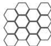
hexagon satin hexagon polished